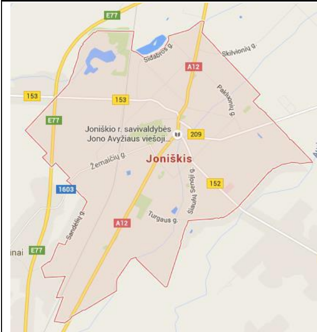
1 pav. Joniškio miesto teritorijos ribos.

Joniškio miestas – Joniškio rajono savivaldybės centras. Miesto teritorija yra nedidelė, užima 895 ha plotą (Joniškio rajono savivaldybės plotas – 115 200 ha).